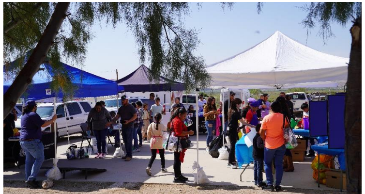
Tents included exhibitions as well as games for the children and adults. Las carpas incluyeron exhibiciones y juegos para niños y personas adultas.