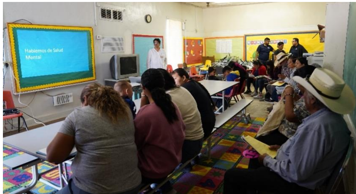
Members of the community gathered to receive education on topics like mental health. Integrantes de la comunidad se reunieron para recibir educación en temas como salud mental.