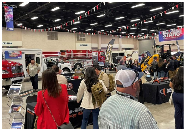
The exhibition hall was a great place to network and learn about new technology and equipment.